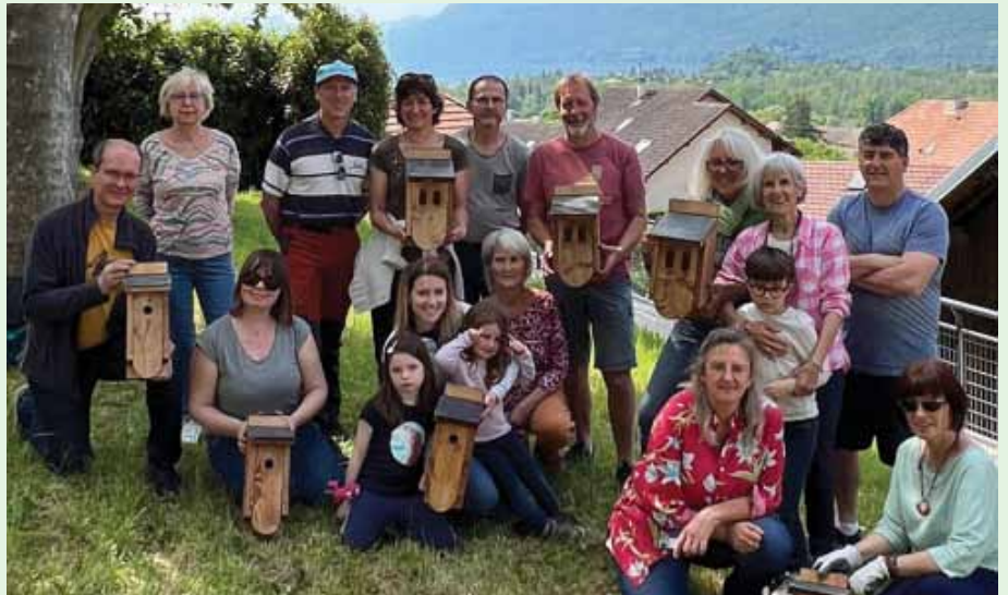
Des Chindrolains ont confectionné des nichoirs posés en différents lieux.